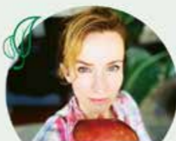
Adina Vetter, Schauspielerin

Am 6. April um 20.15 Uhr zeigt die ARD den neuen Tatort aus Münster „Fiderallala“ mit Adina Vetter. So mörderisch wie die Handlung des Krimis ist ihr Lieblingsgericht nicht, aber durchaus kriminell raffiniert: „Ich liebe Kartoffeln! Besonders wenn sie außen umwerfend knusprig und innen unglaublich fluffig sind. Sie werden nicht vorgekocht oder in Alufolie gewickelt, sondern außen mehrfach mit der Gabel oder einem kleinem Messer eingestochen, damit der Dampf entweichen kann und sie außen knusprig werden. Dann werden sie mit etwas Rapsöl eingerieben und anschließend mit reichlich Salz und Pfeffer gewürzt. Dann ab auf das Rost in den vorgeheizten Ofen bei 250° Grad. Während das Wunderwerk im Ofen eine Stunde vor sich